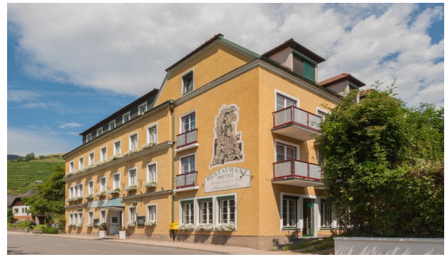
unser Hotel „Stierschneiders Wein Hotel“

Vorerst nur die Impressionen. Eine Fahrt auf der Donau ist ebenfalls vorgesehen. Das Programm arbeite ich jetzt aus.