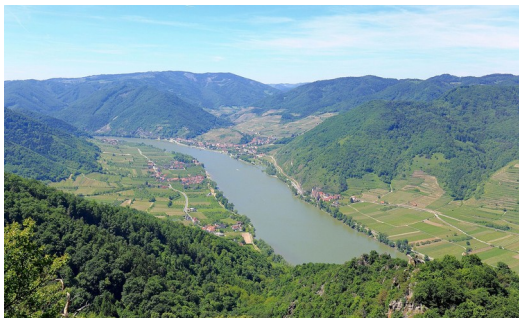
Donau bei Spitz