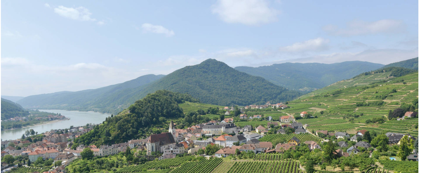
Spitz an der Donau

Dieses Mal fahren wir unser Nachbarland Österreich in die Wachau. Da dieses Jahr die Hotels für eine so große Gruppe, wie wir es sind, nahezu ausgebucht waren, mussten wir die Fahrt in den Goldenen Oktober ( hoffentlich ) verlegen. Das kleine Weinstädtchen Spitz ist unser Ziel. Wir kommen gerade richtig zum „SPITZER TERRASSENWEINHERBST“ bei dem die Möglichkeit besteht, sich durch die Weinkeller zu trinken und zu feiern. Doch auch die Kultur soll nicht zu kurz kommen. Wir besuchen das Stift Melk. Dort dürfen wir voraussichtlich singen. Ich kläre dies gerade ab. Der Pfarrer von Spitz hat schon zugesagt.